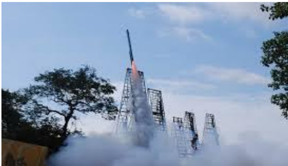
ภาพที่ ๗. ภาพการจุดบั้งไฟ