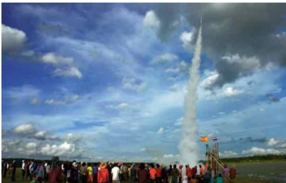
ภาพที่ ๘. ภาพการชมการจุดบั้งไฟ