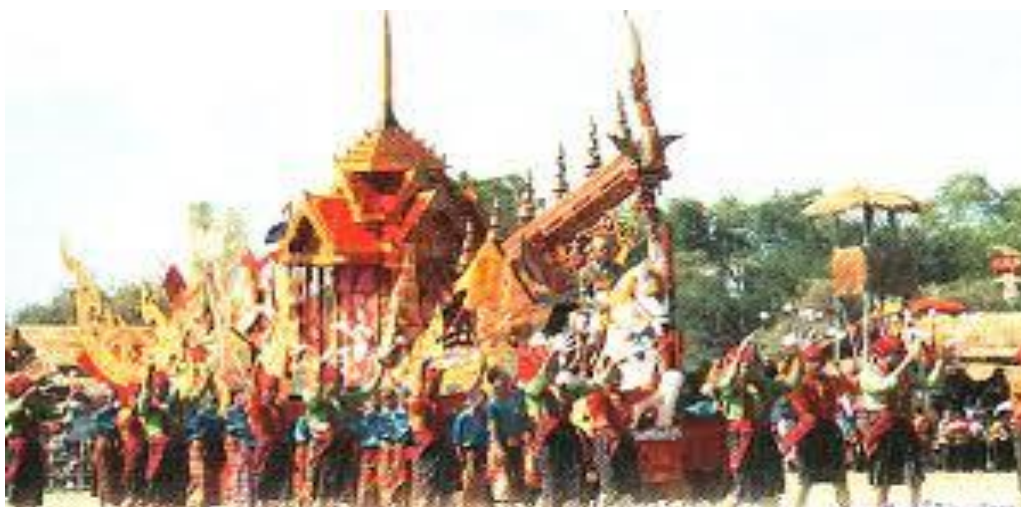
ภาพที่ ๖. ภาพขบวนแห่ประเพณีบุญบั้งไฟ