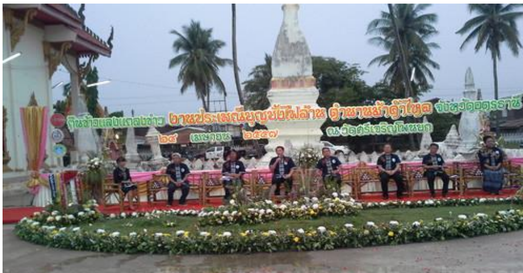
ภาพที่ ๑. ภาพการเตรียมการจัดงานประเพณีบุญขี้ไฟของตำบลบ้านธาตุ อำเภอม้าคำไหล จังหวัดอุดรธานี