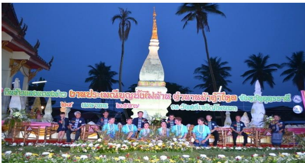
ภาพที่ ๒. ภาพคณะกรรมการจัดงานประเพณีบุญขี้ไฟของตำบลบ้านธาตุ อำเภอม้าคำไหล จังหวัดอุดรธานี