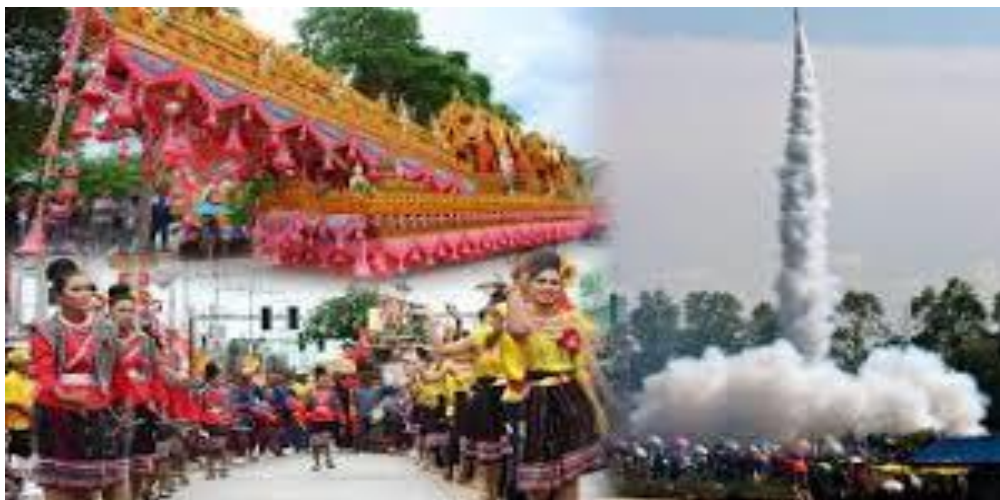
ภาพที่ ๕. การร่ายรำของนางรำในขบวนแห่ประเพณีบุญบั้งไฟ