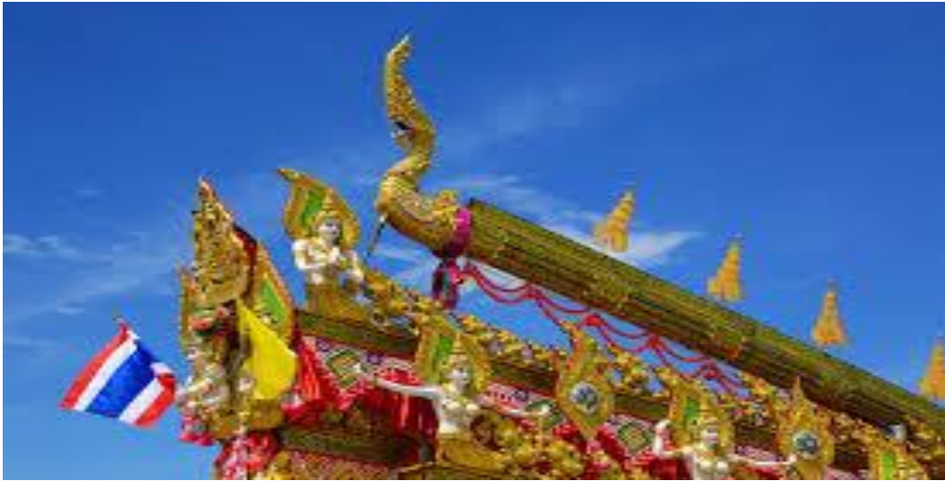
ภาพที่ ๓. ภาพการตกแต่งขบวนแห่ประเพณีบุญบั้งไฟ