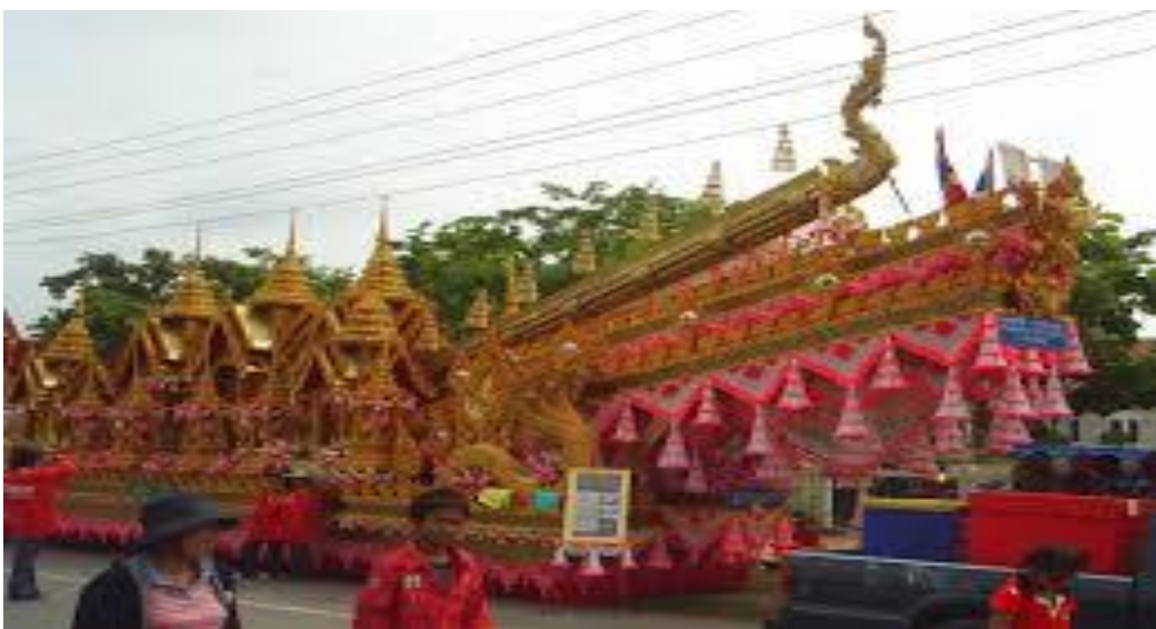
ภาพที่ ๔. ภาพการตกแต่งประดับประดาขบวนแห่ประเพณีบุญบั้งไฟ