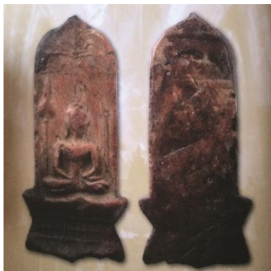
พระยอดขุนพลพะเยา พิมพ์หอกฉัตร ฐานตาราง เนื้อดิน กรุจำตาเหิน