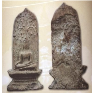
พระยอดขุนพลพะเยา พิมพ์ปรกโพธิ์ ฐานแทนแก้ว เนื้อดิน กรุสันธาตุ ๑๒ กรุสันธาตุ จังหวัดพะเยา