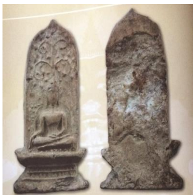
พระยอดขุนพลพะเยา พิมพ์ปรกโพธิ์ ฐานแทนแก้ว เนื้อดิน กรุสันธาตุ