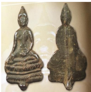
พระยอดขุนพลพะเยา เนื้อชินตะกั่วสนิมแดง หลังเข็ม (พิมพ์ตัดชิดองค์) กรุวัดลี