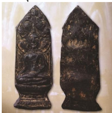
พระยอดขุนพลพะเยา พิมพ์ปรกโพธิ์ เนื้อดิน กรุใต้ต้นโพธิ์วัดอุ่มหล้า