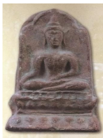
พิมพ์ซุ้มเสมา