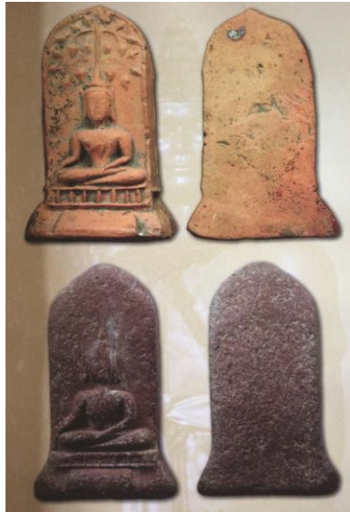
พระยอดขุนพลพะเยา พิมพ์ปรกโพธิ์ ฐานแท่นแก้ว เนื้อดิน กรุสันธาตุ