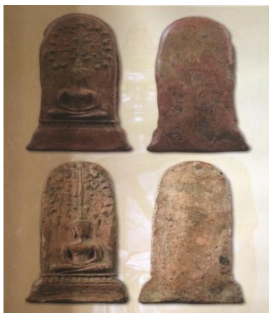
พระยอดขุนพลพะเยา พิมพ์ปรกโพธิ์ เนื้อดิน ปางสมาธิ ฐานขีต กรุสันธาดู