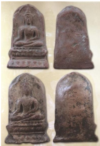
พระยอดขุนพลพะเยา พิมพ์ซุ้มเสมา เนื้อดิน กรุสันธาตุ ๑๔