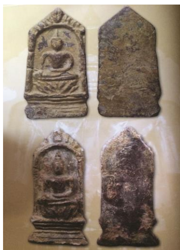
พระยอดขุนพลพะเยา พิมพ์ซุ้มระฆังเรือนแก้ว เนื้อชินตะกั่วสนิมแดง กรุวัดลี