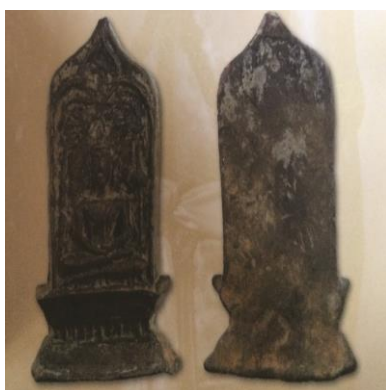
พระยอดขุนพลพะเยา พิมพ์หอกฉัตรฐานตาราง เนื้อดิน กรุสันธาตุ