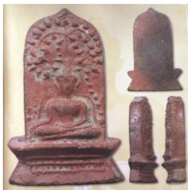
พระยอดขุนพลพะเยา ปางมารวิชัย พิมพ์ฐานตารางข้างเม็ด เนื้อดิน กรุจำตาเหิน