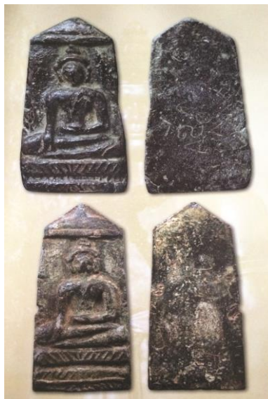
พระยอดขุนพลพะเยา พิมพ์ฉัตรเดี่ยว เนื้อชินตะกั่วสนิมแดง กรุวัดฝางหมื่น