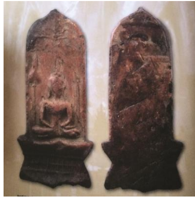
พระยอดขุนพลพะเยา พิมพ์หอกฉัตร ฐานตาราง เนื้อดิน กรุจำตาเหิน ๒๓