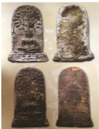
พระยอดขุนพลพะเยา พิมพ์ปรกโพธิ์ ปางสมาธิ ฐานบัวเม็ด เนื้อดิน กรุสันธาตุ