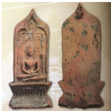
พระยอดขุนพลพะเยา พิมพ์หอกฉัตร ฐานตาราง เนื้อดิน กรุจำตาเหิน