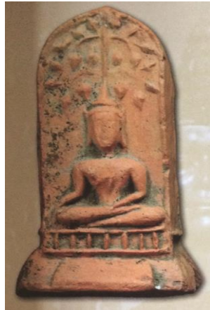
พิมพ์ปรกโพธิ์