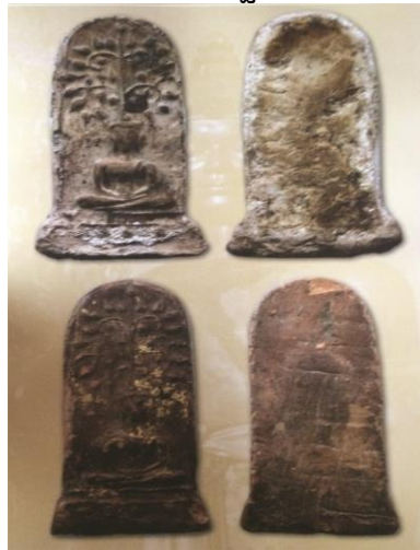
พระยอดขุนพลพะเยา พิมพ์ปรกโพธิ์ ปางสมาธิ ฐานบัวเม็ด เนื้อดิน กรุสันธาตุ ๒๔

พระยอดขุนพลพิมพ์นี้น่าจะนับได้ว่าในแม่พิมพ์พระกรุเนื้อดินด้วยกันแล้ว พระยอดขุนพลพะเยาพิมพ์ปรกโพธิ์นี้ มีความงดงามด้านศิลปะ เป็นพระพิมพ์ที่หาพบเจอได้ยาก และน่าสะสม