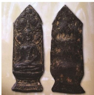
พระยอดขุนพลพะเยา พิมพ์ปรกโพธิ์ เนื้อดิน กรุใต้ต้นโพธิ์วัดอุ่มหล้า ๒๘

พระปางมารวิชัยประทับบนยังจงกลบานดอกเดียวในซุ้ม ฐานปัทม์หกชั้นรองรับบัวมีลายลูกแก้วเป็นจุด เนื้อชินตะกั่วสนิมแดง