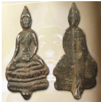
พระยอดขุนพลพะเยา เนื้อชินตะกั่วสนิมแดง หลังเข็ม (พิมพ์ตัดชิดองค์) กรุวัดลี ๓๐

พระปางมารวิชัย เข้าแคบเศียรโต ประทับนั่งกลางซุ้มปราสาทเป็นรูปหน้าขนบสูง มีตา (ถ้ามีเขี้ยวเรียกว่า เกียรติมุข) เสาซุ้มเป็นลายเกลียวเชือกขึ้นไปรองรับตัวหงา และหลังคา เหนือเศียร เป็นจั่วสามเหลี่ยมมีลวดลายเต็มเรียบไม่มีลาย พระเมวลิตูม เนื้อชินตะกั่วสนิมแดง เป็นพิมพ์ที่นิยมกันมาก มีพุทธคุณสูง