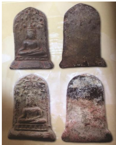
พระยอดขุนพลพะเยา พิมพ์ปรกโพธิ์ ฐานแท่นแก้ว เนื้อดิน กรุวัดพระเจ้าตนหลวง