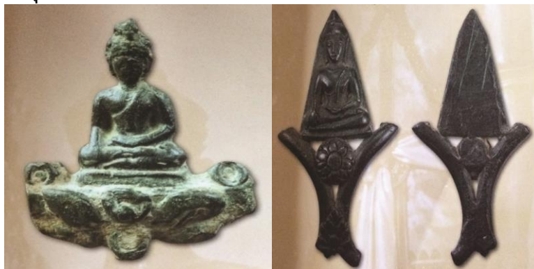
พระยอดขุนพล เนื้อสัมฤทธิ์ กรุวัดมหาพน