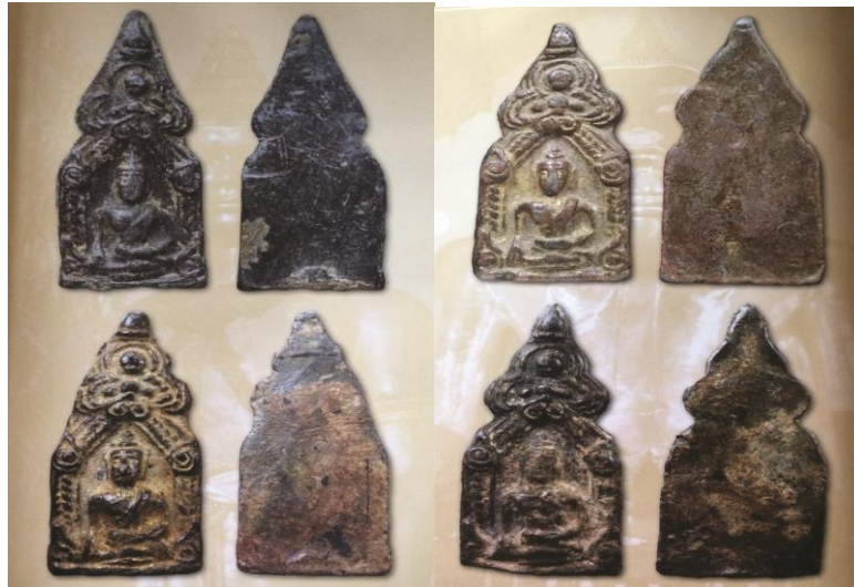
พระยอดขุนพลพะเยา พิมพ์ปราสาทไหว เนื้อชินตะกั่วสนิมแดง กรุวัดป่าแดงบุนนาค ๒๙

พระปางมารวิชัย เข้าแคบเศียรโต ประทับนั่งกลางซุ้มปราสาทเป็นรูปหน้าขนบสูง มีตา (ถ้ามีเขี้ยวเรียกว่า เกียรติมุข) เสาซุ้มเป็นลายเกลียวเชือกขึ้นไปรองรับตัวหงา และหลังคา เหนือเศียร เป็นจั่วสามเหลี่ยมมีลวดลายเต็มเรียบไม่มีลาย พระเมวลิตูม เนื้อชินตะกั่วสนิมแดง เป็นพิมพ์ที่นิยมกันมาก มีพุทธคุณสูง