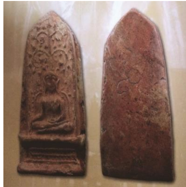
พระยอดขุนพลพะเยา ปางมารวิชัย พิมพ์ฐานตารางข้างเม็ด เนื้อดิน กรุสันธาตุ (ไม่ตัดปีก) ๑๓ ลักษณะไม่ตัดปีก เป็นเนื้อสองสี ขาวแซมแดงไม่ฉูดฉาดมาก เรียกว่าเนื้อกินบ่เลี้ยง