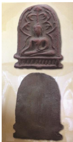
พระยอดขุนพลพะเยา พิมพ์ซุ้มเถาว์ลัยเล็ก เนื้อดิน กรุสันธาดู