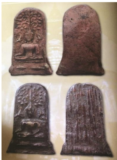
พระยอดขุนพลพะเยา พิมพ์นกปลา เนื้อดิน กรุสันธาตุ