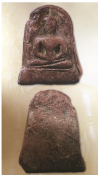
พระยอดขุนพลพะเยา พิมพ์ต้อ เนื้อดิน กรุสันธาตุ