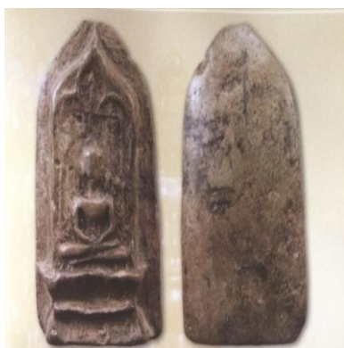
พระยอดขุนพลพะเยา พิมพ์หอกฉัตรฐานตาราง เนื้อดิน กรุสันธาตุ (ไม่ตัดปีก)