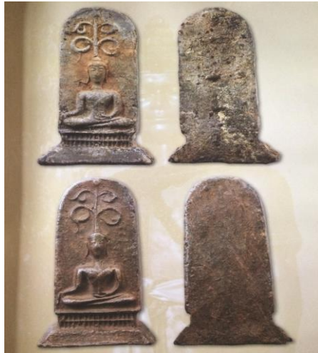
พระยอดขุนพลพะเยา พิมพ์ซุ้มเถาววัลย์ฐานตาราง เนื้อดิน กรุเวียงห้า