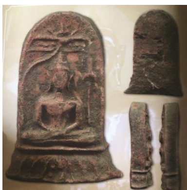
พระยอดขุนพลพะเยา พิมพ์หอกฉัตร ฐานบัวก้างปลา เนื้อดิน กรุสันธาตุ