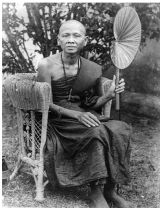
พระครูบาศรีวิชัย ถ่ายรูปนี้เมื่ออายุ ๔๕ ปี ที่หน้าต้นชบาบนพระธาตุดอยจอมทอง คราวไปบูรณะ วัดพระเจ้าตนหลวงและพระธาตุดอยจอมทอง แขวงเมืองพะเยา (พะเยา)