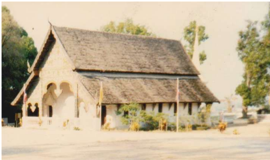
วิหารหลังแรกของวัดศรีสุดาที่พระครูบาศรีวิชัยสร้างขึ้นเมื่อปี พ.ศ.๒๔๗๗ ปัจจุบันวัดได้รื้อ 'วิหารครูบาศรีวิชัย' และสร้างหลังใหม่ขึ้นมาแทน