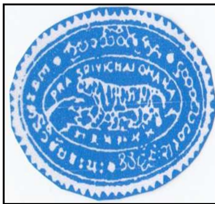
ตราประจำตัวของพระครูบาเจ้าศรีวิชัย มี ๕ ภาษา ไม่ปรากฏหลักฐานว่าเริ่มใช้ตราเมื่อปี พ.ศ.ใด ๑