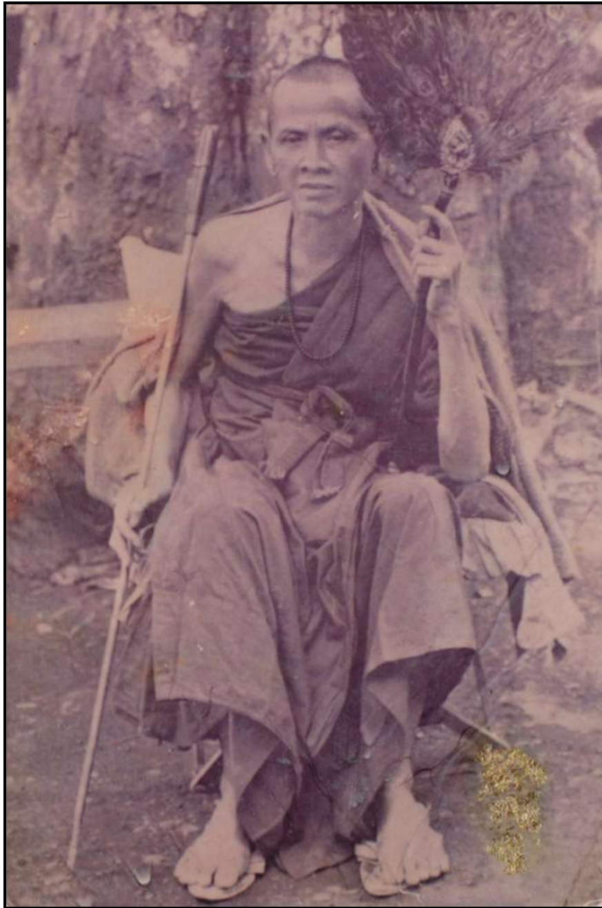
พระครูบาศรีวิชัย เมื่ออายุ ๕๖ ปี นุ่งห่มผ้าจีวรแบบปรัดอก แขนวลูกประคำที่คอ นั่งบนเก้าอี้ ถัดไม้เท้าและถือพัดหางนกยูง ถ่ายที่วัดศรีโสดา เชียงใหม่ ปี พ.ศ.๒๔๗๗