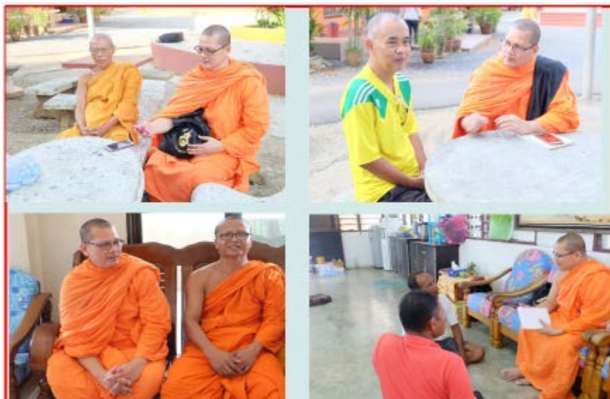
สัมภาษณ์เชิงลึกปฏิบัติหน้าที่แทนเจ้าอาวาสวัดกุบังศิมา