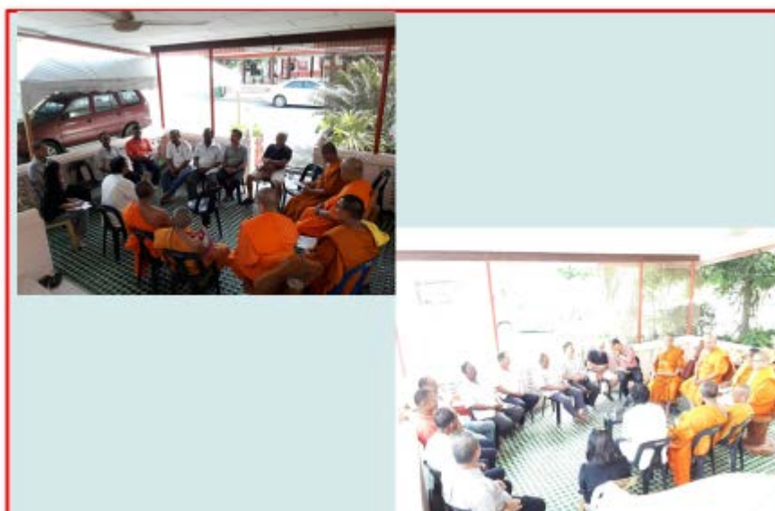
สนทนากลุ่ม (FocusGroup) การพัฒนาสังคมชาวสยามในรัฐเปอร์ลิส ณ วัดมัจฉิมาประสิทธิ์